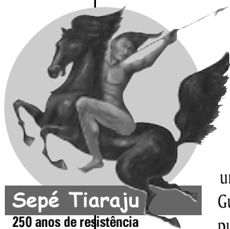
Sepé Tiaraju 250 anos de resistência

A comunidades tem os mesmos cargos que a zona, incluindo um secretário, dois advogados e os delegados de clubes esportivos.