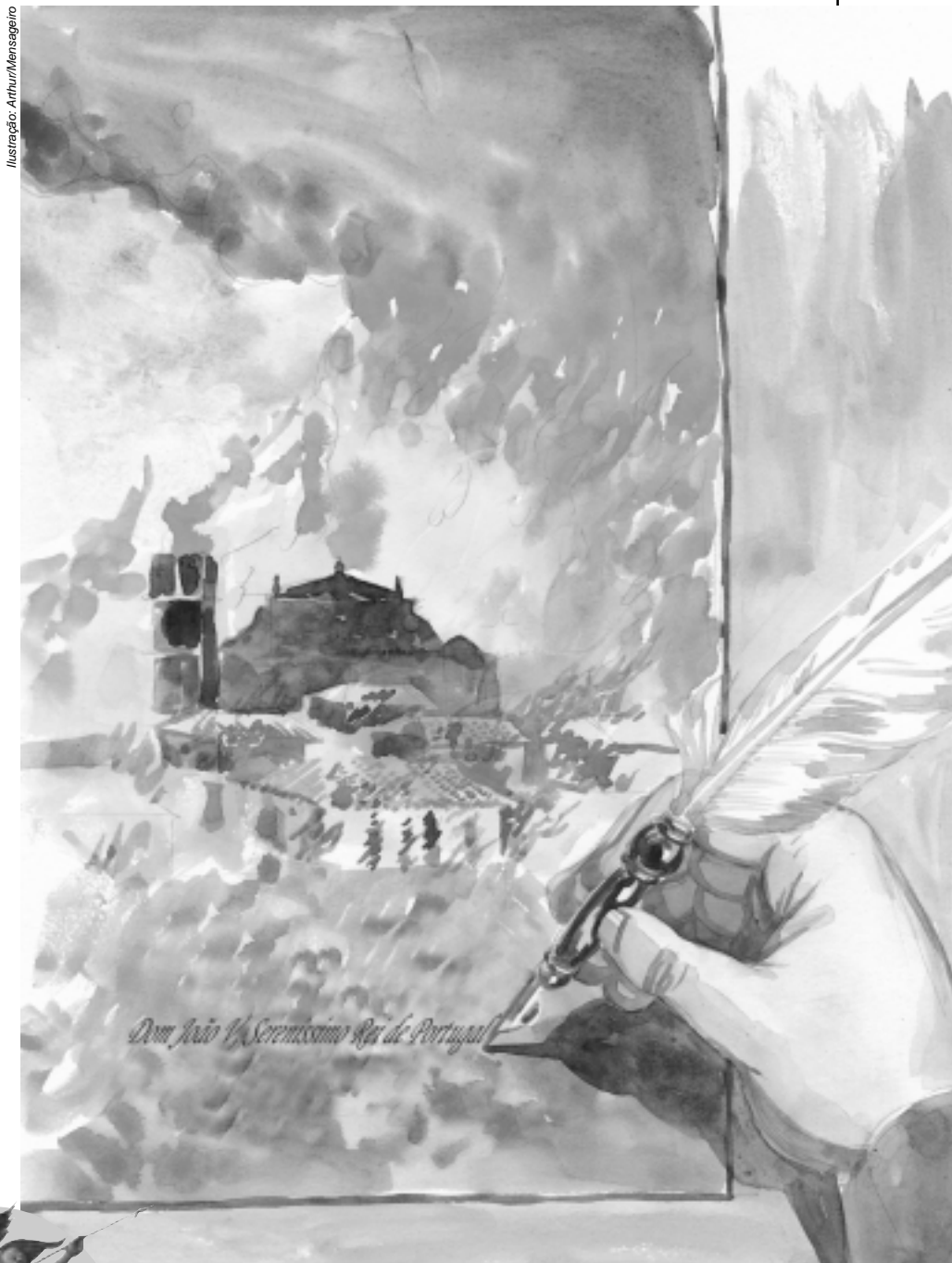
Ilustração: Arthur Mensageiro

No diário do general português Gomes Freire de Andrade, um dos comandantes