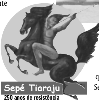
Sepé Tiaraju 250 anos de resistência

gerais da guerra, há um importante detalhe, omitido nos textos acima, e que mostra o final trágico de Sepé: